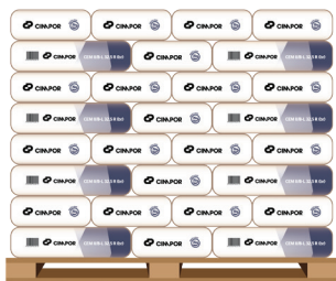
Paleta plastificada - Tara perdida 64 Sacos de 25 kg - 1600 kg

Camião de 25 toneladas com meios de descarga próprios devidamente selado