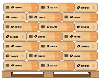
Paleta plastificada - retornável 56 sacos de 25 kg - 1400 kg