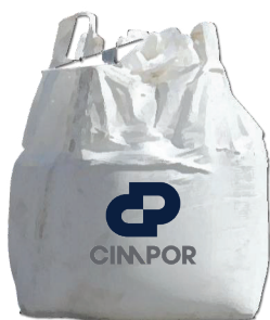
Big Bag 1400 kg

Camião de 25 toneladas com meios de descarga próprios devidamente selado