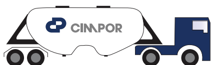
Granel ±25 toneladas

Camião de 25 toneladas com meios de descarga próprios devidamente selado