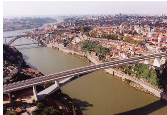
Ponte do Infante

Clínquer \geq 95\% ; Constituintes adicionais minoritários \leq 5\% ; Sulfato de cálcio regulador de presa.